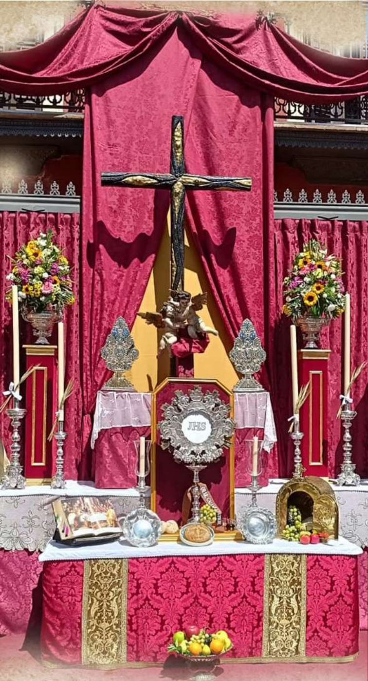
Fotografías: José Luis Cardoso Macías, Miguel Ángel Sanz Arroyo. Diseño: J. Jesús Bolaños Valverde